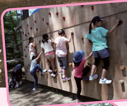
クライムウォール

磐梯山麓に広がる開放的なロケーションで1日思いっきり外遊び! 遊びのメニューは、6月にオープンしたばかりの冒険遊び場「わくわくプレイパーク」のアトラクション(クライムウォール・モンキーブリッジ・ターザンロープ・ゆらゆらハンモック)と、東京のスペシャルチームによる大人気「なんじゃ忍者道場」(人数限定)を楽しめます!!