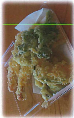
天ぷら盛り合わせ